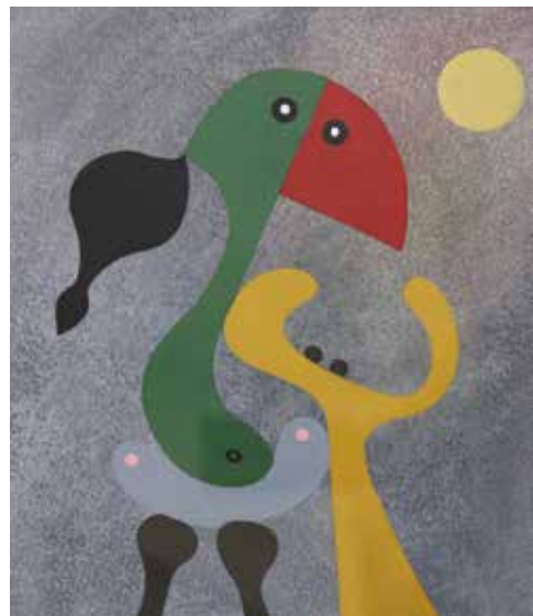
Desmond Morris (nacido en 1928) Zoologista, autor y artista de Oxford