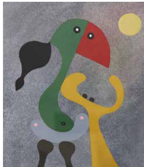
Desmond Morris (nacido en 1928) Zoologista, autor y artista de Oxford